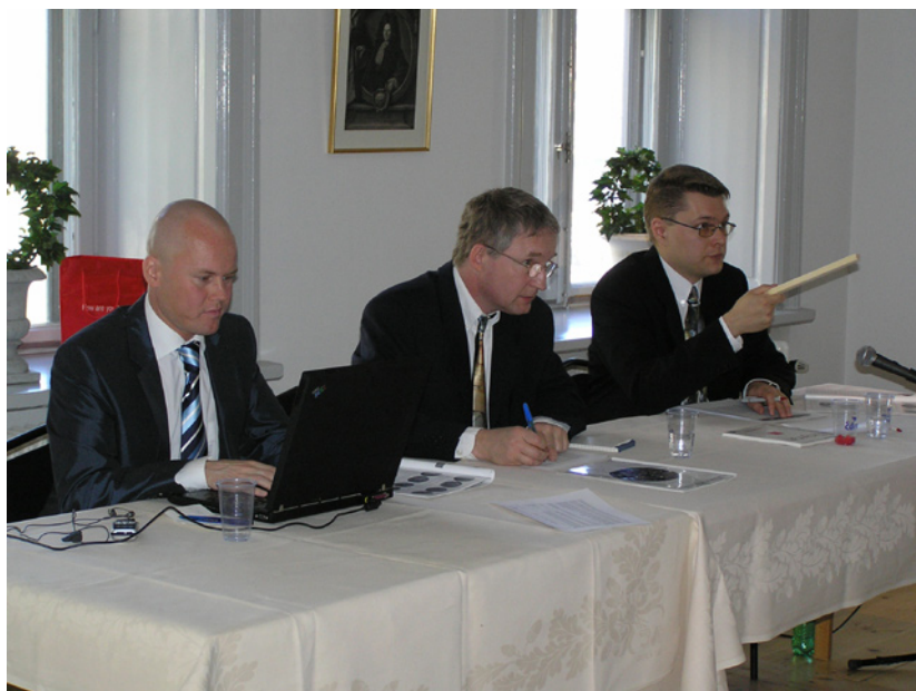
Bild 4. Ett utsnitt av podiet från Aurums premiärauktion 2005-05-15.