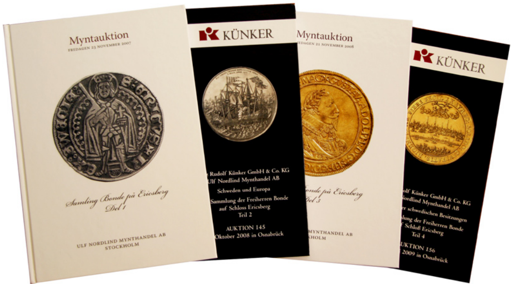
Bild 1. Bondesamlingens fyra första auktionskataloger.

teter som sedan den första auktionen i november 2007 med ungefär två auktioners takt per år nu fördelas på nya ägare.