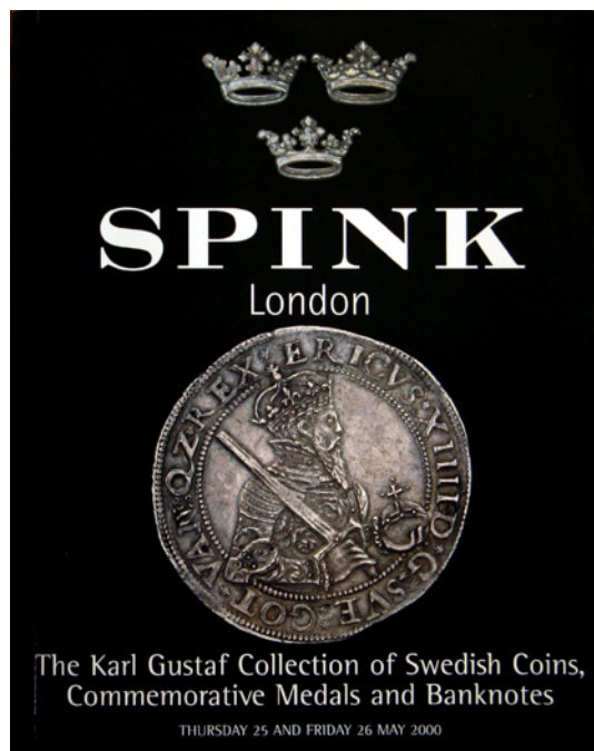
Bild 2. Spinks auktionskatalog över The Karl Gustaf Collection of Swedish Coins, Commemorative medals and Banknotes från försommaren 2000.

Auktionen betingades av spännande och oväntade förutsättningar. Katalogiseringen blev ambitiöst genomförd, med angivande av omskrifter och interpunktioner rörande de äldre mynten. Nästan samtliga äldre objekt avbildades vilket är